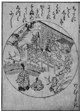
図2 『源氏大和絵鑑』(国立国会図書館デジタルコレクション) (DOI:10.11501/2542790)

で、「若紫」の場面が〈視覚的〉に理解しやすくなるかもしれません。また、菱川師宣画「源氏大和絵鑑」(請求記号…寄別五—五—三—一—六)の源氏絵もあります「図2」。 広重の浮世絵と比較すると、お供がいない、飛んでいく雀の姿が描かれる、などの違いが見られます。こういった絵の比較を行うことで、授業で扱った「若紫」の場面がより記憶に残る手助けとなるのではないのでしょうか。 加えて、社会や美術など他教科で学習する菱川師宣や歌川広重らが「源氏物語」の絵を描くという事実は、教科を越えたつながりや文学の広がりを実感する機会となります。