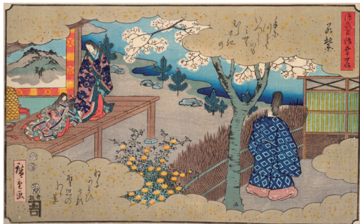
図1 「源氏物語五十四帖 若紫」(国立国会図書館デジタルコレクション) (DOI:10.11501/1308829)

申込みは不要です。 とあります。つまり、当サイトの画面左に記載される「書誌情報」、「公開範囲」が「インターネット公開（保護期間満了）」となっているものは、図書館に申請することなく利用が可能です。