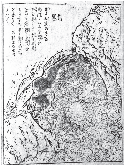
図3 『今昔画図続百鬼』「鬼」(九州大学附属図書館蔵、請求記号: 41/1/096)

今回取り上げたサイトはほんの一例に過ぎません。他にも、国文学研究資料館、国立公文書館、東京大学、京都大学、早稲田大学、立命館大学、慶應義塾大学、同志社大学、愛知県立大学など、数多くの機関や図書館がデジタルアーカイブを公開しています。基本的に所蔵先を提示し、学校の授業で使用する分には申請が不要な機関が多いですが、いきなりすべてのデジタルアーカイブのことを理解するのは面倒と感じるでしょう。今回は、比較的使用しやすいサイトを紹介しました。次頁の参考URLから、ぜひ一度利用してみてください。