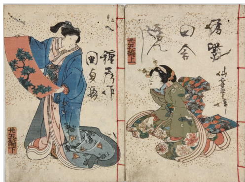
使用した和本の一例『偽紫田舎源氏』（多色刷）