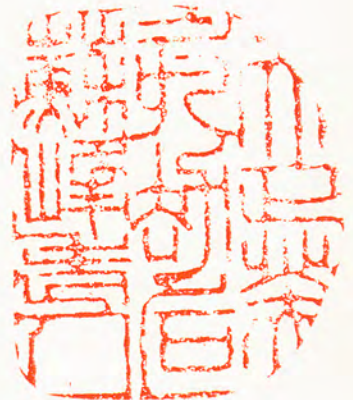
(大正癸亥以後蘇峰老人)