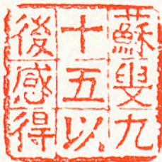
(蘇叟九十五以後感得)