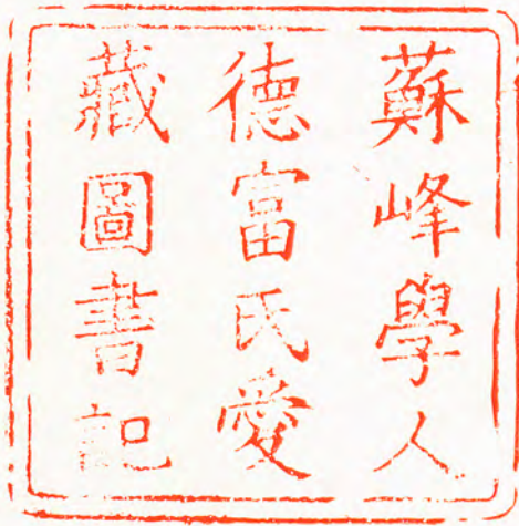
(蘇峰學人德富氏愛藏圖書記)