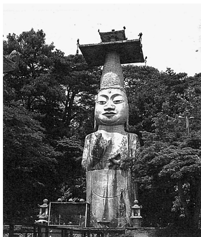
図2 ウンジンミル 恩津弥勒（正式名「灌燭寺石造弥勒菩薩立像」 〔韓国民族文化大百科事典〕

2 主人公が最後に訪ねたのは、⑩の壁、⑫の山を除き、すべて弥勒である。表に見るように「恩津弥勒」「弥勒」「石仏」などの呼称で登場する。