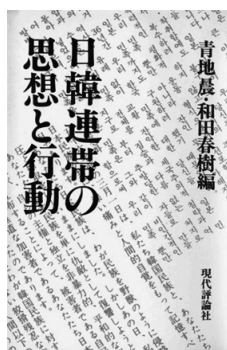
図1 青地農・和田春樹編『日韓連帯の思想と行動』表紙

ここでは金大中拉致事件をきっかけに始められた日韓連帯運動について考えてみようと思うが、その際にまず、同時代に運動に携わった当事者たちが整理し、叙述した文献が手がありとなる。1977年に出版された青地農・和田春樹編『日韓連帯の思想と行動』はその代表的なもので、1973年8月の金大中拉致事件から出版直前の1977年3月までの、運動を主導した人々の文や記録、声明、決議文などが掲載されている 2 。この本自体がさながら日