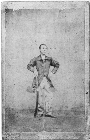
赤松小三郎肖像写真 慶応3年撮影