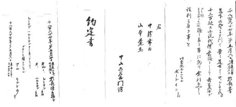
図5 D. B. 銃千三百挺購入約定書