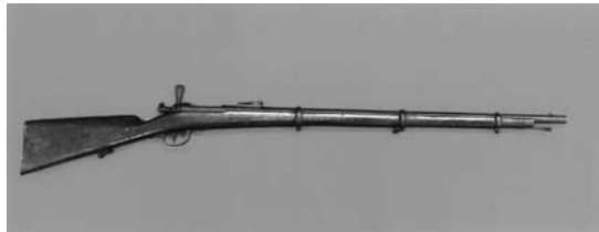
図6 D. B. 銃 (霊山歴史館蔵)