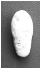
図7 D. B. 銃の弾頭 (2.5×1.2cm 20g) (筆者蔵)