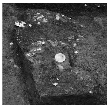
写真 1 SD4005 出土状況（西から）

ただし、土師器皿が大量に集中して出土することは少なく、その場合は意図的に一括廃棄されたものであると推定される。SD4005 では、白色と褐色の皿が混在している。それらは 14 世紀の相国寺創建期前後の土師器皿であり、儀式に伴って廃棄された可能性がある。