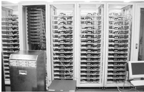
Fig. 1. SuperNova Cluster System.

SuperNova クラスターの各ノードはデュアルプロセッサであるため、各ノードで2つの仮想 OS を稼働させる。すなわち計 32 個の仮想 OS を稼働させる。各ノードは 2GB のメモリを搭載しており、2つの仮想 OS とその仮想 OS を管理するための OS が動作する。各 OS に割り当てるメモリ量は、各仮想 OS は 768MB、仮想 OS を管理するための OS は 512MB に設定した。