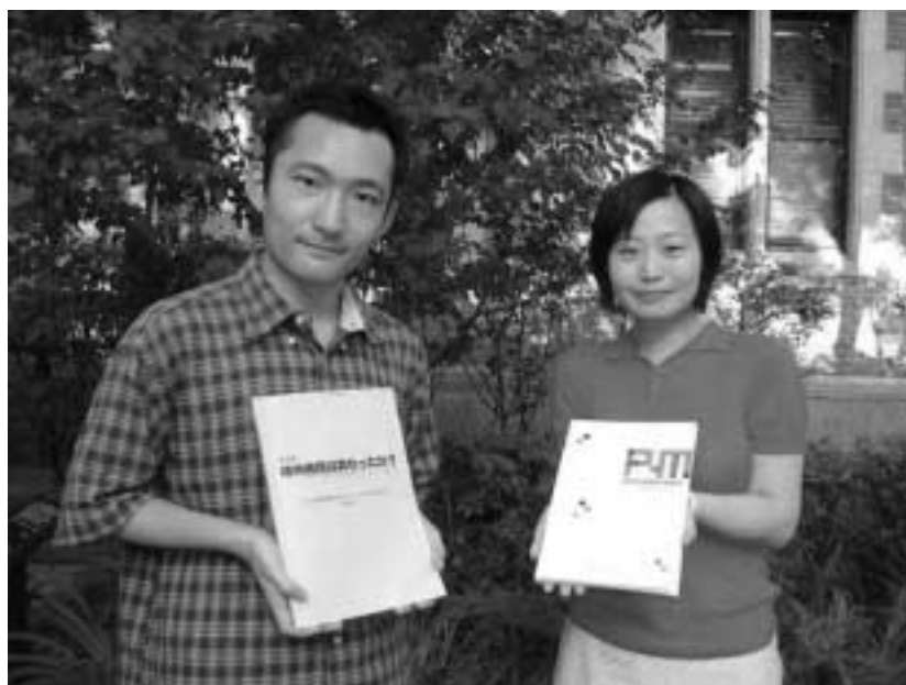
同志社大学今出川キャンパス・ハリス理化学館横にて