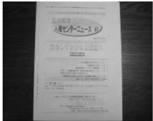
人権センターが発行している「人権センターニュース」その活動について詳細に綴られています。

NPO 大阪精神医療人権センター HP http://www.psy-jinken-osaka.org/