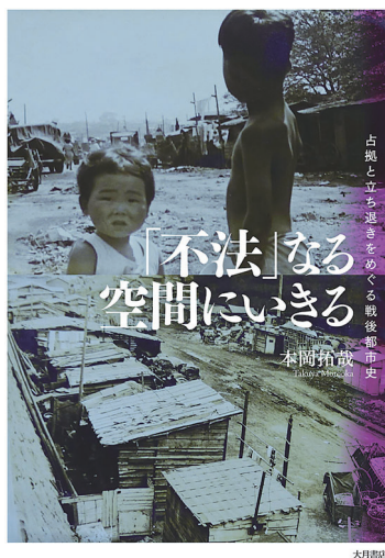
図1-1: 書影『「不法」なる空間にいきる—占拠と立ち退きをめぐる戦後都市史』

昨日(12月3日)、大阪で外出自粛の要請が出たことで、参加を控えられた方も多いようですが、本講座には定員50名のところに、80名の参加申請があり、多くの方が関心を示してくれました。現在、日本学術会議の任命拒否問題に見られるように、学術に対して大変厳しい状況にあるかと思いますが、このようにたくさんの方々にご参加いただいたことは、本当にありがたいと思います。学問への高