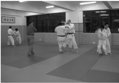
龍心館での練習風景