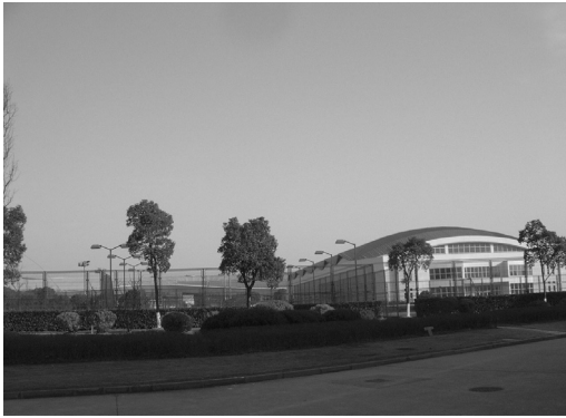
東方緑舟体育訓練基地の建物