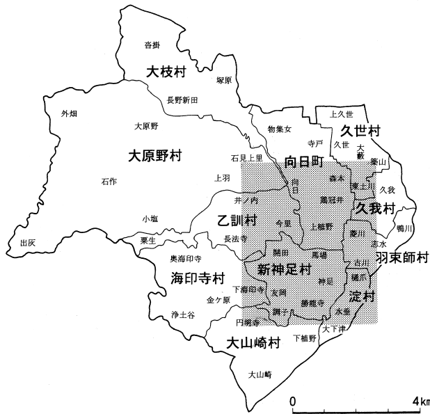
図1 明治中期の乙訓郡の町村と大字 ※長方形のスクリーントーンをかけた場所が 長岡京跡のおよその範囲

中樞が集まる宮域は、現在の向日市域に営まれていた。史跡としての長岡宮跡は、向日市鶏冠井町に現在も地名として残る大極殿とその南隣の祓所に、大極殿・小安殿跡として整備されているのをはじめ、周辺に点在する朝堂院西第四堂跡・内裏内郭築地回廊跡・築地跡と合わせて四カ所が、現在、国の史跡に指定されている。大極