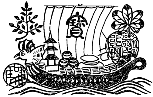
図2 京都鞍馬寺の宝船

例年中行事 (6) の節分行事の項には、「五条天使」すなわち五条天神社へ青土が使いに行き、「御札一枚・宝船一枚・おけら七ツ・かや七ツ・かちくり七ツ・せう (勝) のふもち七ツ (餅) ・あめ七ツ・こんふ枚」の八品を受けてきている。これを「奥御一の間御床」の上に納置した。一方、三条家には禁裏から授与される「たから船」もあった。三条家の御所様(当主)やその家族には杉原すりの宝船、奥向(奥御殿)に仕える老女たちには半紙すりの宝船が授与された。「御寝のとき御所様御はしめ杉原すりの御宝船を御枕の下に御敷遊す。天使の宝船へ御札と一所ニ御床ニ納置事。老女はしめ半紙すりの宝船一枚つゝいたゞき、各枕の下ニ敷へき事也。」とあり、枕の下に敷いて寝る宝船は禁裏よりの宝船、奥御一の間御床に飾る宝船は五条天神社の宝船というように、使い分けをしている。