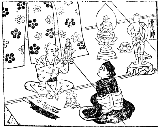
〈図2〉『人倫訓蒙図彙』巻五（元禄初期）（朝倉治彦校注、東洋文庫、平凡社、平2・6）