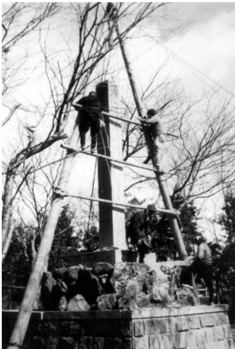
写真 1895年(明治28)に建設された長岡宮城大極殿遺址碑 (写真は1965年に移設されようとしているところ)