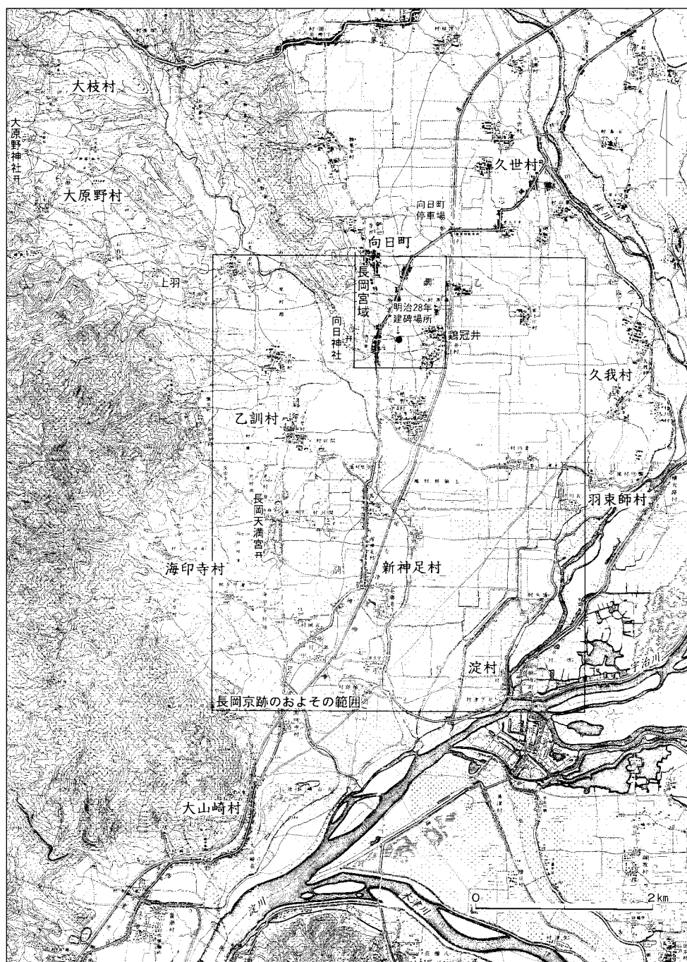
図3 1889年(明治22)頃の乙訓郡の町村と長岡京跡